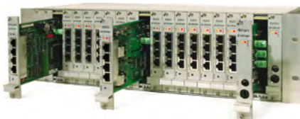
Exemple d'un modèle version II 19 pouces entièrement équipé