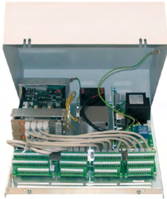
Unité de base III entièrement équipée (boîtier pour pose au mur)