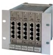
Exemple d'une unité de base I 19 pouces

L'IDT 32 est une unité de gestion moderne et High End, pouvant convenir de manière flexible aussi bien à des applications de contrôle d'accès, de gestion des alarmes, de détection incendie que des applications vidéo. De conception modulaire, l'IDT 32 dispose de 1 à 21 slots pour répondre précisément aux exigences du client tout en restant simple d'installation par le principe Plug-and-Play.